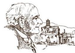
Centro di Studi e Ricerche Bartolommeo Capasso

Il Centro di Studi e Ricerche “Bartolommeo Capasso”, con il Patrocinio del Comune di Sorrento, e in collaborazione con F.I.D.A.P.A. Penisola Sorrentina, “Azione in Comune” di Massa Lubrense e Penisola Verde s.p.a., promuove per il Natale 2024 la XLV Edizione del Concorso